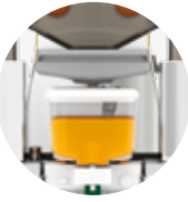
Speed Pro Cooler Podium